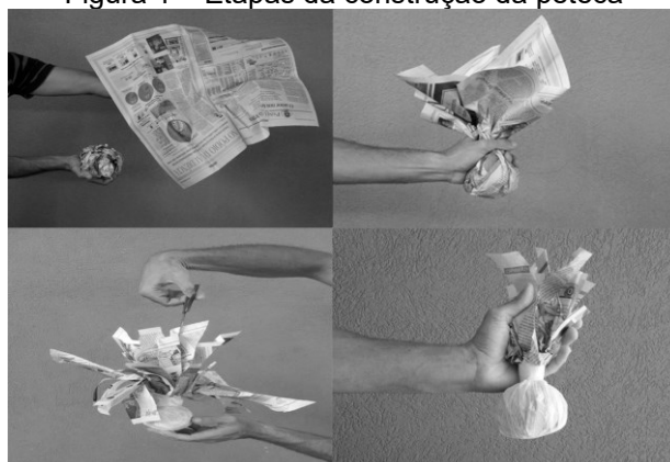
Figura 1 – Etapas da construção da peteca

A peteca foi construída, em sua base, com uma folha de jornal amassada, colocada no centro de outra folha sobreposta, cujas pontas puxaram-se para cima. Um barbante foi utilizado para fixar ao meio as folhas de jornal que envolveu a folha amassada e lhe deram formato de bola na parte inferior. Uma sacola plástica foi usada para revestir a base com o auxílio de fita adesiva. As pontas de jornal foram cortadas em tiras de cima para baixo até o barbante, o que deu leveza ao objeto. O passo a passo de sua construção é demonstrado na figura 1, a seguir.