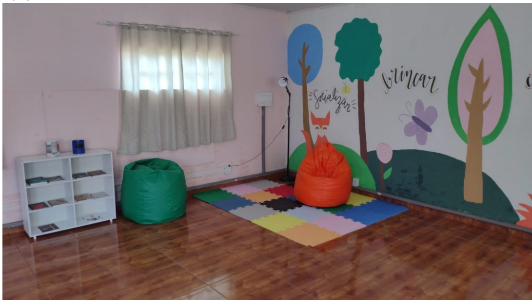
Figura 3 – Montagem do kit do projeto e pintura da parede em um dos municípios de intervenção em 2023.