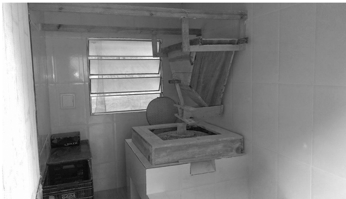
Figura 2 – Moinho movido a motor elétrico construído por um agricultor de Paula Cândido.