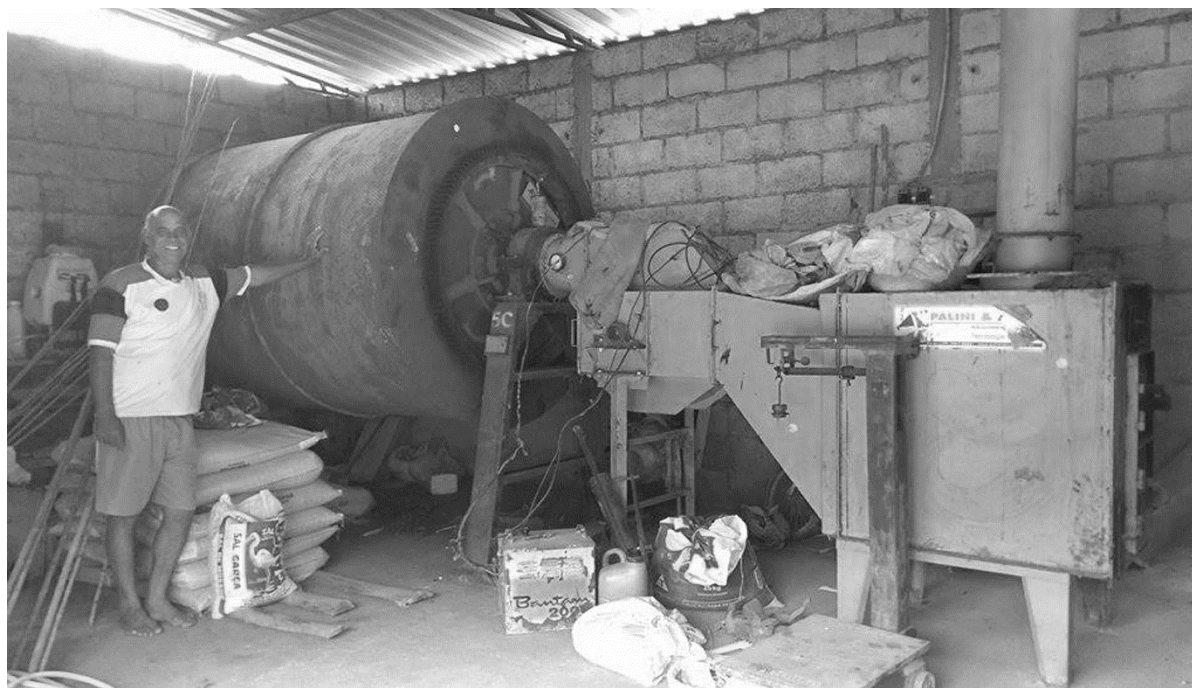
Figura 1 – Agricultor de Paula Cândido e sua máquina de secar café.

A grande maioria dos entrevistados respondeu positivamente sobre a aquisição de equipamentos voltados à produção agropecuária após a obtenção do serviço de energia elétrica – 68,8% em Brás Pires, 76,5% em Paula Cândido e 87,5% em Porto Firme. Dentre esses, percebeu-se unanimidade quanto à obtenção de bombas d'água, que além de facilitarem a manutenção de plantações e criações, são de suma importância para o abastecimento do domicílio e, conseqüentemente, para a saúde e higiene de seus habitantes. Comprova-se, deste modo, as ideias sugeridas por Di Lascio e Barreto (2009), Oliveira (2001), Reiche, Covarrubias e Martinot (2000), Ribeiro e Santos (1994), de que a melhoria na captação da água apresenta impactos positivos sobre a qualidade de vida e o trabalho da população rural. Destacaram-se também a compra de motores utilizados em moinhos, picadeiras e ensiladeiras, bem como aquisição do aparato necessário para irrigação, ordenha e resfriamento de leite e derivados (tanque e freezer), e processamento do café. Nas Figuras 1 e 2, têm-se exemplos de novos bens adquiridos por beneficiários do programa após o acesso à energia elétrica.