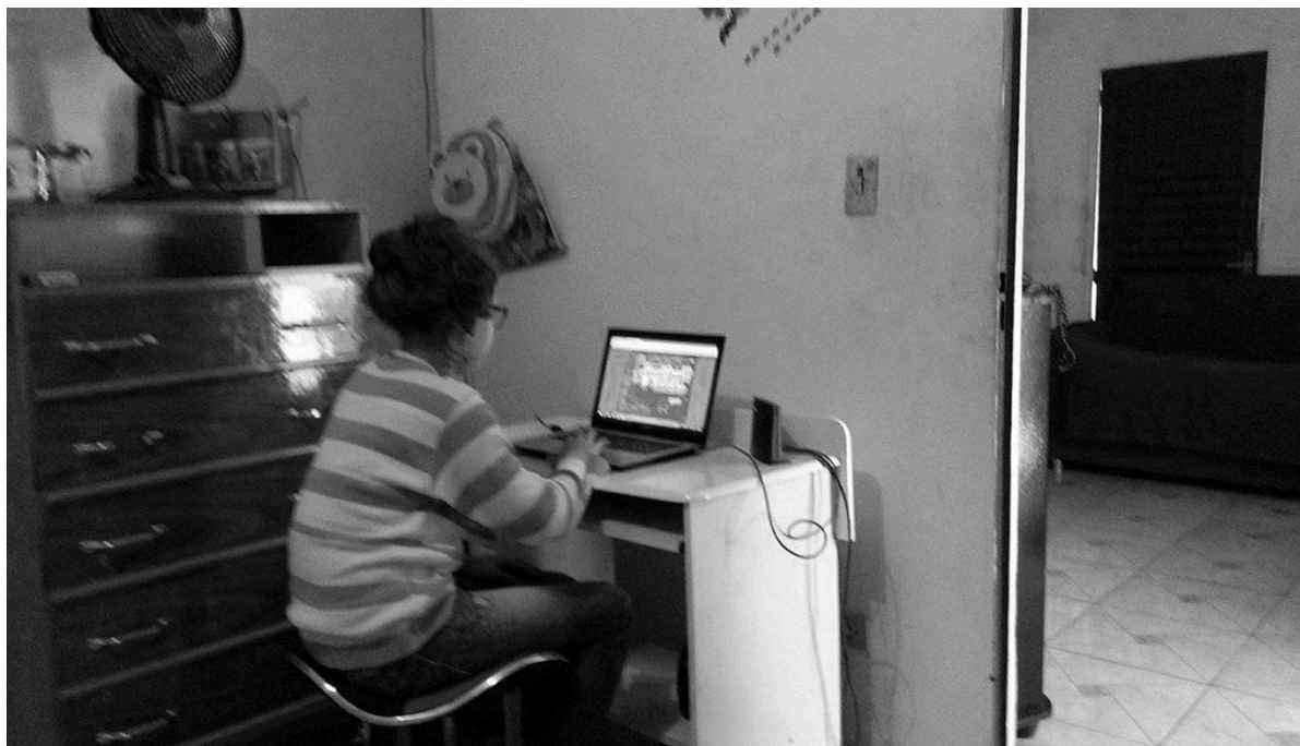
Figura 3 – Estudante de Porto Firme utilizando seu computador em casa, no meio rural.

municípios. Em geral, cerca de 82% dos respondentes dos municípios representantes dos grupos Médio-alto e Médio-baixo confirmaram essa relação. Por outro lado, mesmo sendo maioria, apenas 56% dos respondentes de Brás Pires seguiu este pensamento. Esta situação também foi observada quando se indagou sobre as chances de permanência no meio rural, caso a energia elétrica ainda fosse de difícil acesso: enquanto em Porto Firme e Paula Cândido registrou-se afirmações de que as chances de permanência seriam baixas ou muito baixas, para Brás Pires as respostas concentravam-se mais entre chances altas de permanência e indiferença quanto à relação investigada.