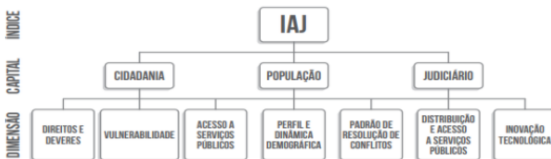
Figura 1 – Representação esquemática do índice de Acesso à Justiça e seus componentes