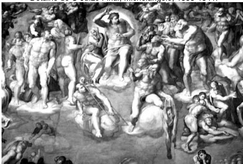
Detalhe de O Juízo Final, Michelangelo, 1535-1541.

Colhendo tais indicações, talvez possamos lançar uma leitura sobre o motivo de Agamben ter associado o autorretrato de Ticiano, como Midas, ao autorretrato de Michelangelo, como São Bartolomeu, no afresco O juízo final . Neste, Michelangelo/São Bartolomeu está ao lado do Messias (que, sendo católico, diferente do de Benjamin, “retorna”), segurando sua própria pele. Se, à luz messiânica, o “fim” é o “meio” e o mundo está, “indigente e desfigurado”, com suas fendas à mostra; se, no juízo final, “o olho deve ver seu ponto cego”, o artista, então, põe a si mesmo como matéria de representação, mas um si mesmo como cindido, no corpo de um outro, entre a santidade e a animalidade, entre a salvação e a destruição. É esse “entre” que, à luz messiânica, aparece como um “resto” – o hiato que une e separa potência e impotência (AGAMBEN, 2014). Mas ele “aparece” sem imagem possível, pois trata-se do ponto cego do olho que se volta a si mesmo. Somente pode “aparecer”, num instante de perigo, como um lampejo, como um rastro.