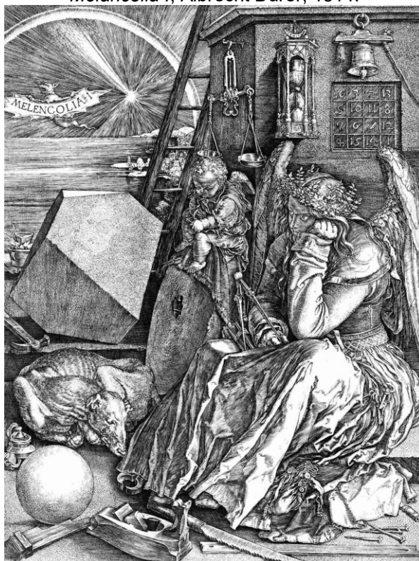
Melancolia I , Albrecht Dürer, 1514.

Há algo naquilo que se vê – os objetos de mensuração do mundo, a punição do sátiro pelo coroadado Apolo – que se mostra como ruína e que fala sobre o que resiste à própria fala, ou, então, o que resiste à voz, a mudez. As palavras através das quais conhecemos as coisas (e o mesmo poderíamos dizer sobre as imagens através das quais as coisas se oferecem à visibilidade) pressagiam uma tristeza, uma tristeza que emudece (BENJAMIN, 2011, p. 70-71). Não é de qualquer tristeza